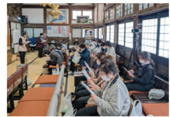
仏教婦人会 役員地区役員総会