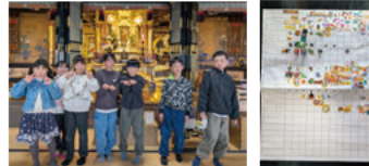
1年間楽しくお参りました(3月)