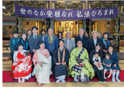
第54回初参式参加者記念写真