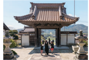
またお参りしてね(4月)